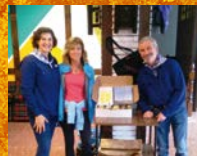
Mirenlur Batis Saria: Errigorako produktuak.