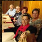
Talde berriak martxan. Urriaren 21ean lehenengo topaketa.