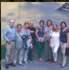
Berbalagunak udan ere elkartu dira.