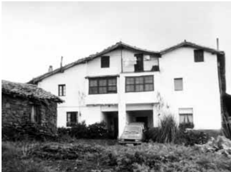
Bidetxe baserria, 1979.

Azken aldian, bokal arteko -d- galdu egin da ( -d- > \emptyset ):