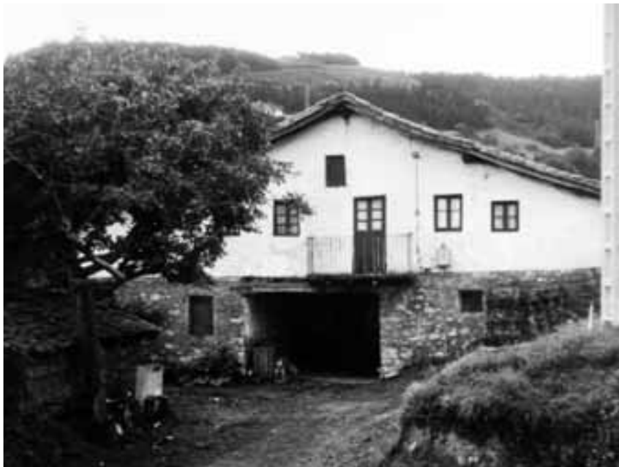
Lupetegi baserria, 1979.

XVIII. mendearen lehen laurdenera arte ez da Lopategi aldaera jaso. Ordutik aurrera, Lopategi eta Lupategi aldaerak jaso dira.