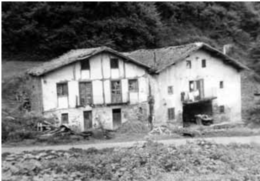
Aranondo baserriak, 1979.