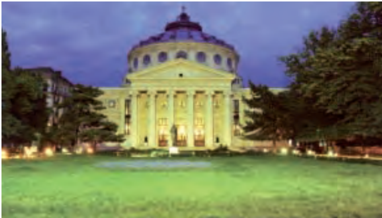
Ateneoa - Bukarest.

Bukaresten bisitatu beharreko tokiak dira Artearen Museo Nazionala, lehengo Errege Gazteluko eraikinean dagoena, Historiako Museo Nazionala, Calea Victoriei-en, Ateneoa eta Curtea Veche, hiriko lekurik zaharrena eta XV. mendean margoturiko eliza duena. Curtea Veche da hiria fundatu zen lekua.