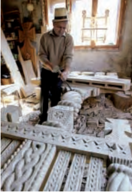
MARAMURES. Etxeetako egurrezko ateak egiten.