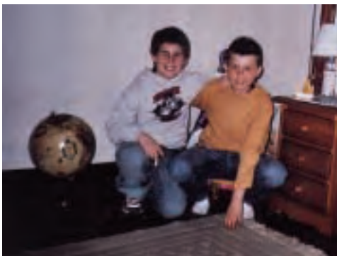
PRAHOVAKO MUTIKO BAT, BERMEOKO BERE LAGUN BATEKIN. 2005eko argazkia da. Haur eta gazteek berehala egiten dituzte lagunak eskolan eta euskara ere helduek baino azkarrago ikasten dute.

Komunismoaren ondoren itxi zituzten fabrika guztiak. Komunismo garaian, errumaniar guztiak lana eta etxebizitza zuten; hainbat lanpostu eta etxe eraiki zituzten langileentzat. Janaria, ordea, "razionatu"