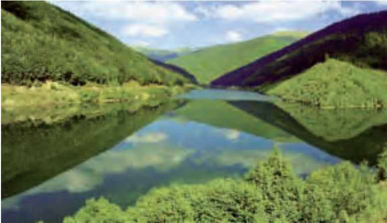
OLT IBAIAREN HARANA. Olt ibaia Trantsilvanian jaiotzen da, eta Danubio- ra isurtzen ditu bere urak. Iparraldea turismorako oso erakargarria da.