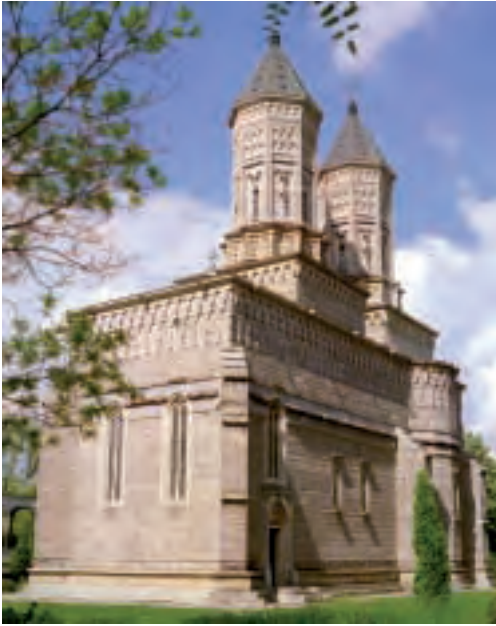
IASI: Trei Lerarhi eliza. Eraikuntza arkitektura valaca eta moldaviarren sintesi bat da, eta Ekialdeko irudiekin zizelkaturiko fatxadak ditu. Evlia Celebik 1659an esan zuen moduan, "ez idazlumarekin, ez hitzarekin ez dago deskribatzerik".