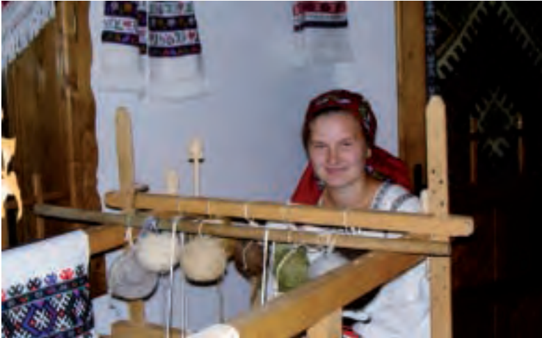
EMAKUMEA EHUNTZEN. Artisanu lana da nagusi.