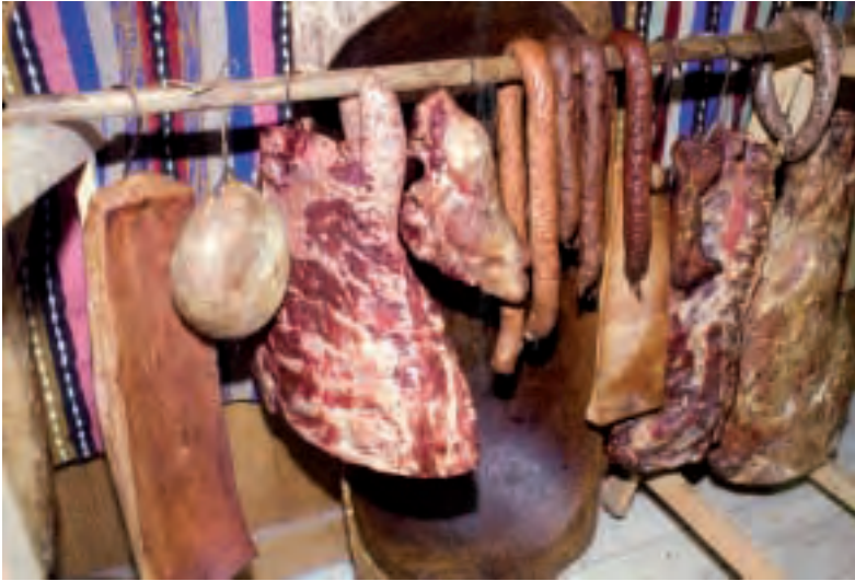
Txerriak lehortzen sukaldean zintzilikatuta.