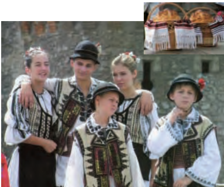
Haurrak eta gazteak jantzi tradizionalak soinean dituztela, eta ogi otzarak artisau-opilekin.