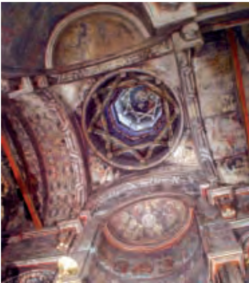
DRAGOMINAR-KO MONASTERIOA: NAOS MARGOA. Harrizko eliza da irudikoa, 42 metroko altuerakoa, Moldaviako altuena, Arte Zaharreko Museoa da egun.