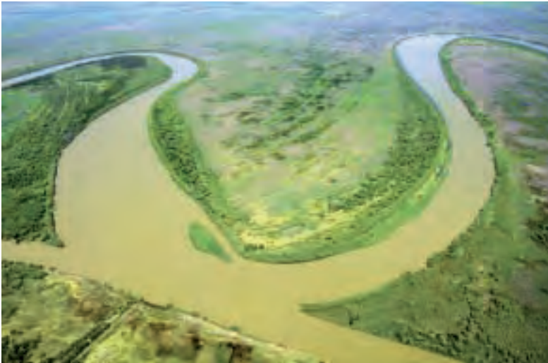
Danubioko delta. .

Leku babestu izendaturiko bederatziz natur parke daude Errumanian. Bermeon bizi diren Prahova probintziakoak, Bucegi mendien ingurukoak dira. Karpatoetan hainbat hegazti eta animalia espezie daude.