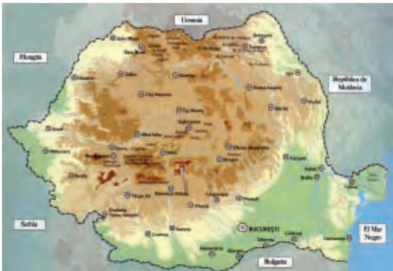
Errumaniako mapa fisikoa.

Herrialdea hiru eskualdetan bana daiteke. Erdian Trantsilvaniako meseta emankorra, eta meseta hori inguratuz arku baten itxurako mendikatea osatzen duten Karpatoak daude, eta horien inguruan, lautadak.