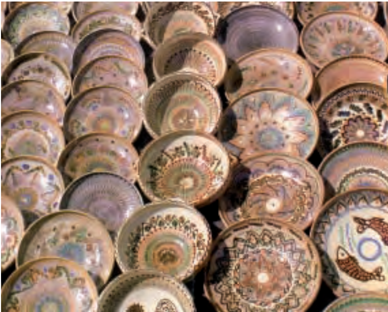
Olteniako zeramika bereziki garrantzitsua da.