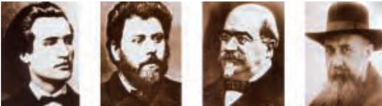
Mikhail Eminescu Ion Creangă Mikhail Kogălniceanu Nicolae Iorga

Errumanieraz eta latin hizkera erabiliz idatziriko lehen testua, "Eslaviar elizako liburuak" 1508. urtean argitaratu zen eta bi mendetan erlijio testuak soilik idatzi ziren errumanieraz. Errumaniako literatura modernoa independentziarekin batera jaio zela ezan daiteke, XIX. mendearen erdialdean. Mikhail Eminescu olerkaria, Ion Creanga eleberriz eta ipuin idazlea eta Ion Luca Caragiale antzerkigilea izan ziren pizkunde garaiko idazle nagusi batzuk.