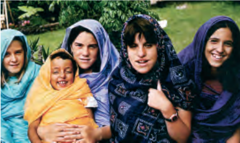
Bermeotarrak Melfakaz eta Aicha sahararra, Bermeon

Bermio Sahararen Alde Elkartearen laburdura da Besalde. Saharar herriari laguntzeko lanetaz arduratzen da berau, Euskal Herrian zein errefuxiatuen kanpamenduetan. Urtero egiten den janari bilketa kanpainan kanpamenduetara bidaltzeko lekaleak, atun latak, konpresak... batzen dituzte. Horretarako, fraideetan daukate lokala eta han batzen dira bermeotarrak nahiz sahararrak. Horrez gain, udan etorriko diren umeez ere arduratzen dira. Aipatu behar da datozen haurren kopurua umeok etxeetan hartzeko prest dauden familien arabera izan ohi dela.