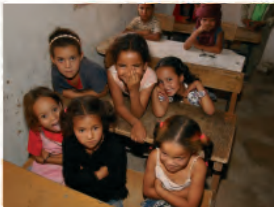
SAHARAKO irakasleak prestatzeko proiektua garatzen ari da Eusko Jaurlaritzako Hezkuntza Saila.

Horien artean egon daude Saharako irakasleak prestatzeko proiektua garatzen ari da baina berriz ez du irakasleekin lan egiten.