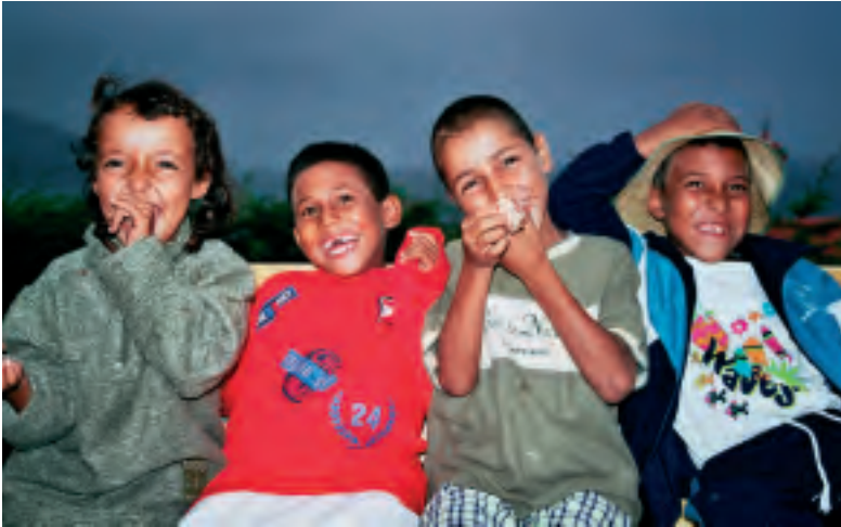
4 MUTIKO SAHARAR, IRRIBARTSU. A zer bihurri aurpegiak!

2004an zortzi ume saharar egon ziren Bermeen. Eta 2005ean, hamaika. Uztailaren hasieran iritsi ohi dira, eta irailaren hasieran, hile bi pasa eta gero, itzultzen dira berriro errefuxiatu sahararren kanpamenduetara.