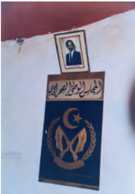
EL UALI. El Uali, Fronte Polisarioaren sortzaile eta liderra. Erakunde honek saharar herriaren eskubideak defendatzen ditu, egun marokoarren mende dauden Mendebaldeko Saharako lurak, hain zuzen ere.

Historia garaikidearekin amaituko dugu atal hau. Zenbait erakunderen eta munduko eskualde hartako herrialde batzuen laguntzaz, Tindufen bizi ahal izateko behar zen espazioa sortzeari ekin zitzaion. Lekua ez zuten kasualitatez aukeratu; Aljerian egonik, marokoarrak ezin pasatu zitezkeenez, lekurik ziurrena zen. 1979an Mauritaniako