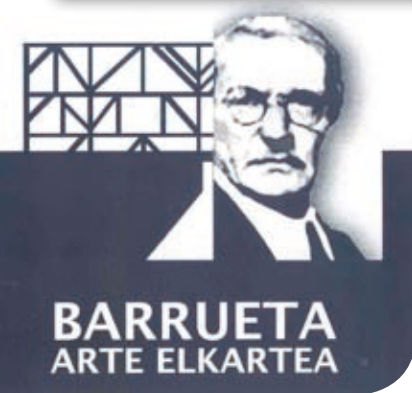
BARRUETA ARTE ELKARTEA