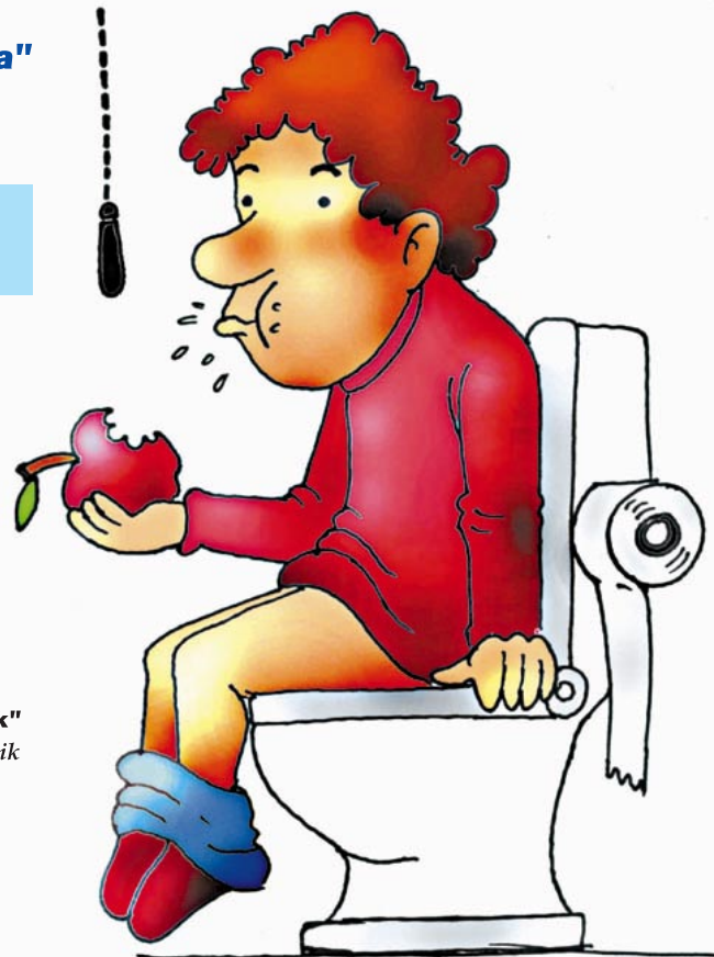
"jan barik,etxauk kakarik" Jan barik ez jagok kakarik