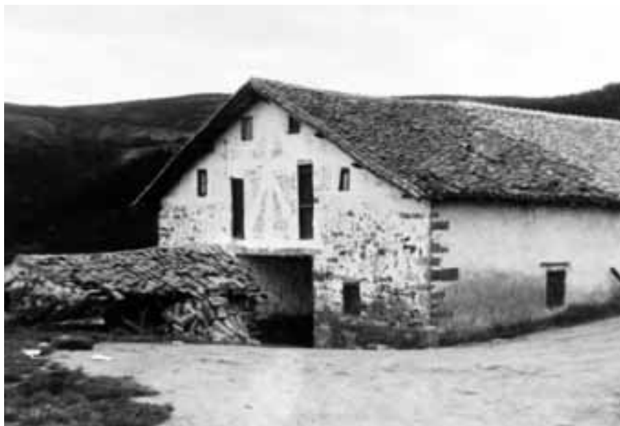
Luzarraga baserria, 1979.