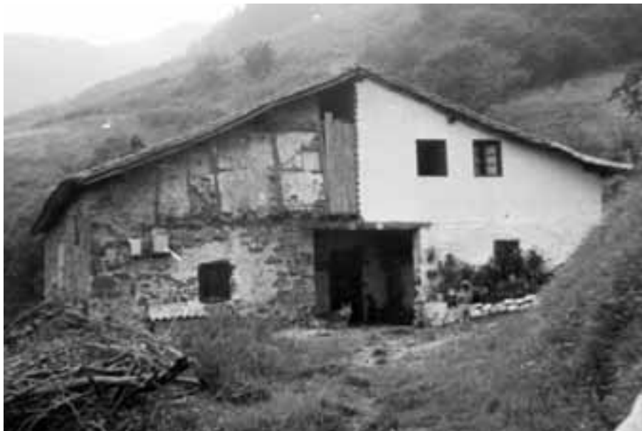
Etxebarrimotzene baserria, 1979.