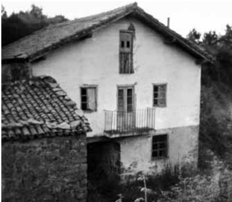
Txaoletagoiko (Paulogorri) baserria, 1981.